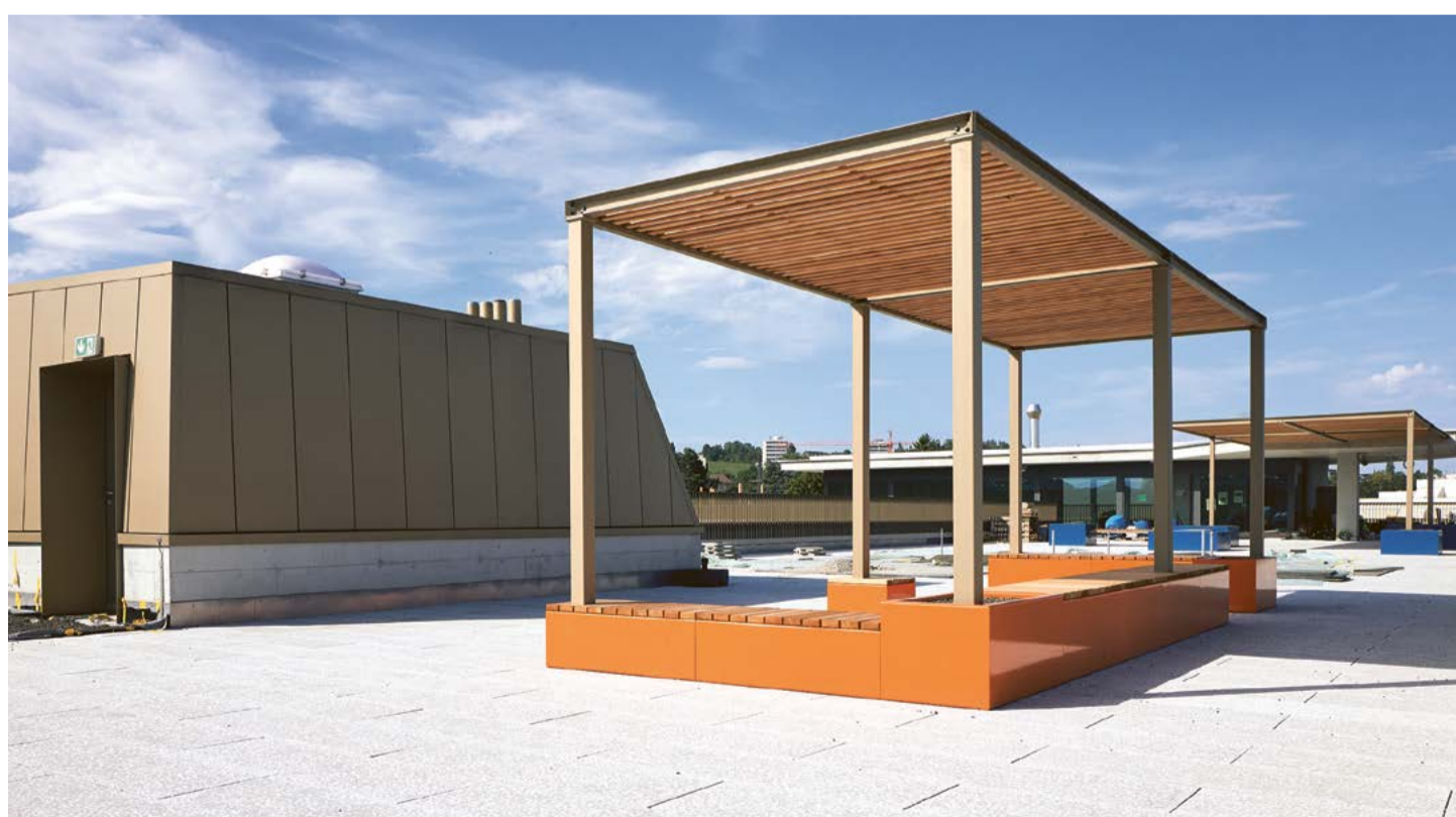
Au moment de la photo à la mi-août, les pergolas n'étaient pas encore dotées de végétation.

Plusieurs hôtels à insectes ont été installés dans deux zones végétales qui ramènent de la nature en toiture. Ils procurent un refuge pour la biodiversité tout en étant didactiques pour les enfants.