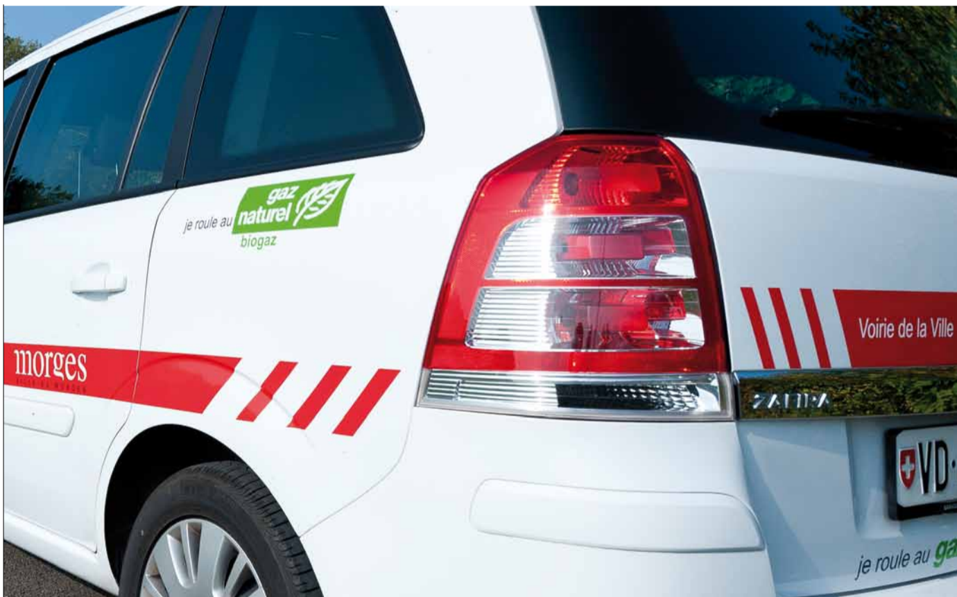
Un exemple de véhicule propre

Yves PACCAUD, Municipal Aménagement du territoire et développement durable