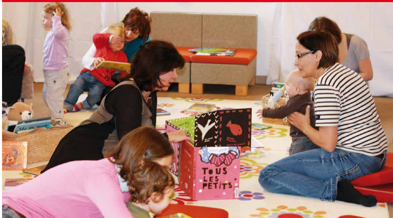
Une séance de lecture à la bibliothèque de Morges

MORGES - BULLETIN D'INFORMATION COMMUNAL - DÉCEMBRE 2010 - REFLETS N°2