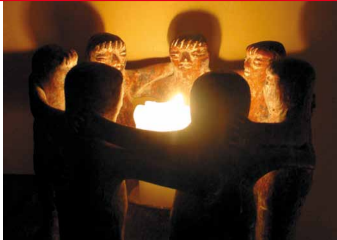
P.5 Pas seul à Noël: Le pas vers l'autre!