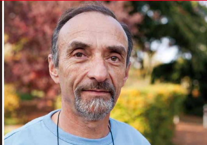
P.6 Les concierges: Des travailleurs de l'ombre