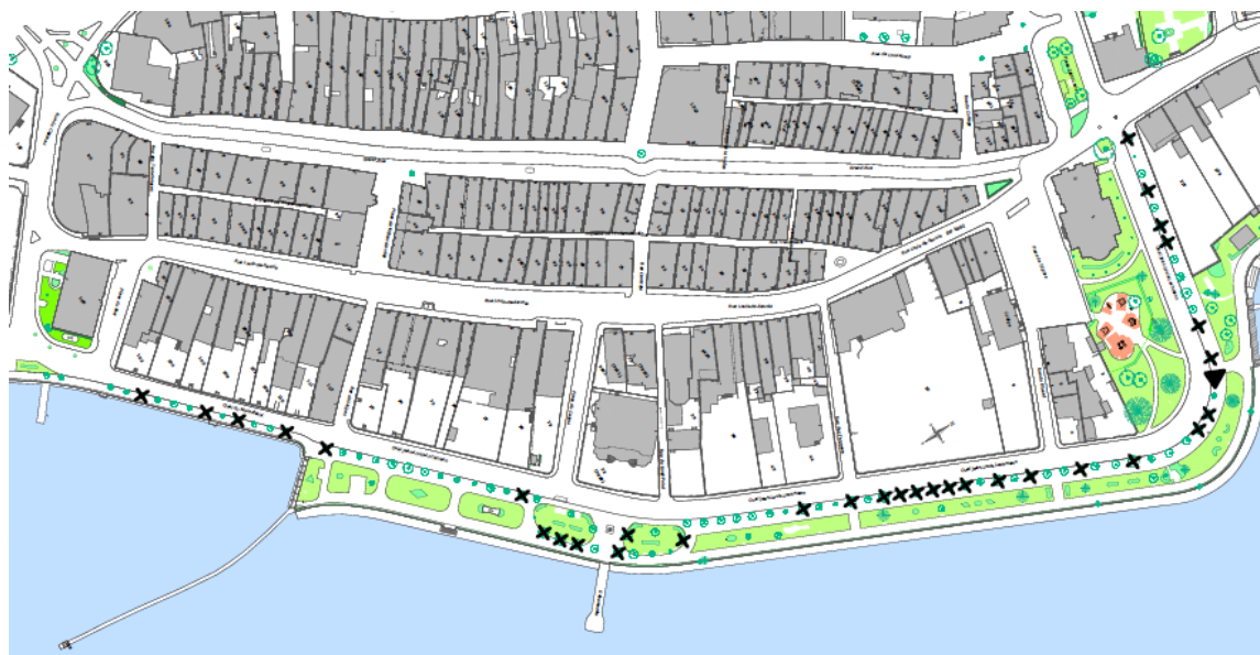
Plan de situation des plantations

Le plan ci-dessous présente avec une croix, les arbres qui sont à remplacer après abattage, avec un triangle un emplacement vide qui doit être comblé afin de respecter les alignements et avec des ronds les arbres qui peuvent être maintenus car sains.