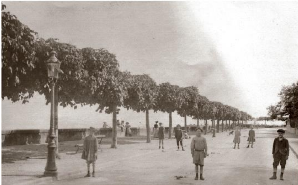
Ambiance le long des quais et alignement de marronniers aux environs de 1920.

Les gabarits sont restés les mêmes et les remplacements au cours de ces dernières années sont réalisés en respectant l'aménagement des quais et en taillant les arbres en forme de plateaux. Cette taille a certainement été réalisée afin de préserver le droit de vue des propriétaires riverains suite à l'aménagement du quai Jean-Louis Lochmann gagné sur le lac.