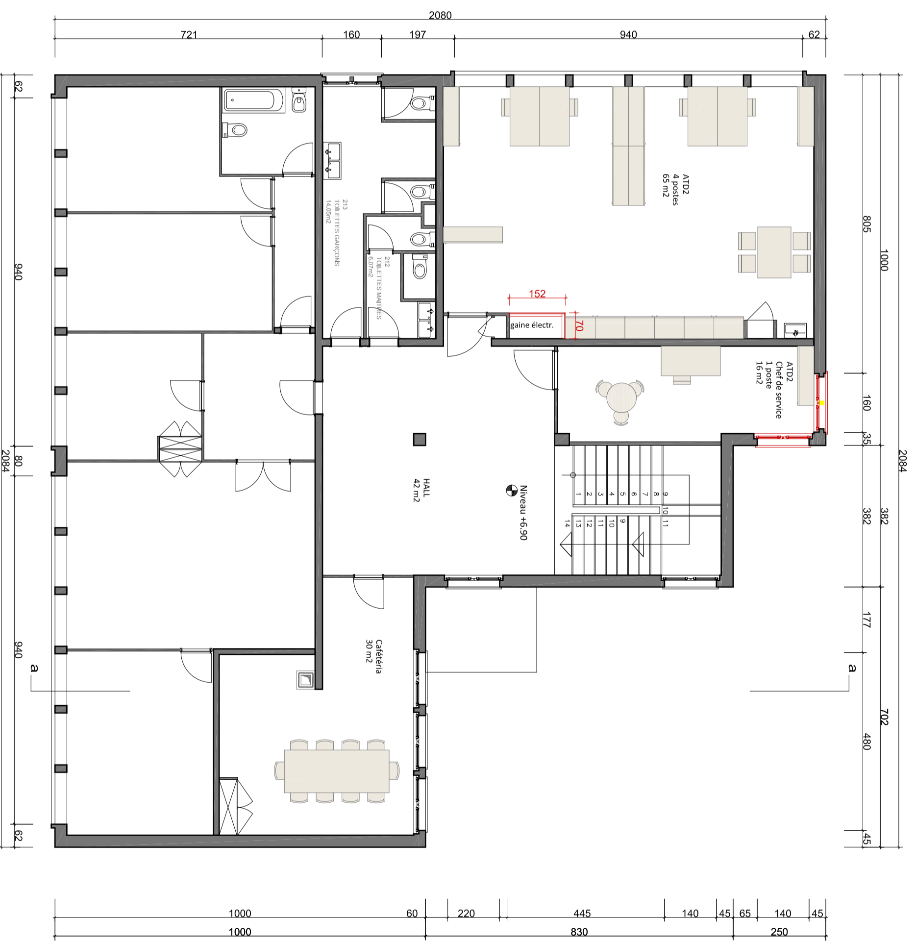
2ème étage - 1/1000