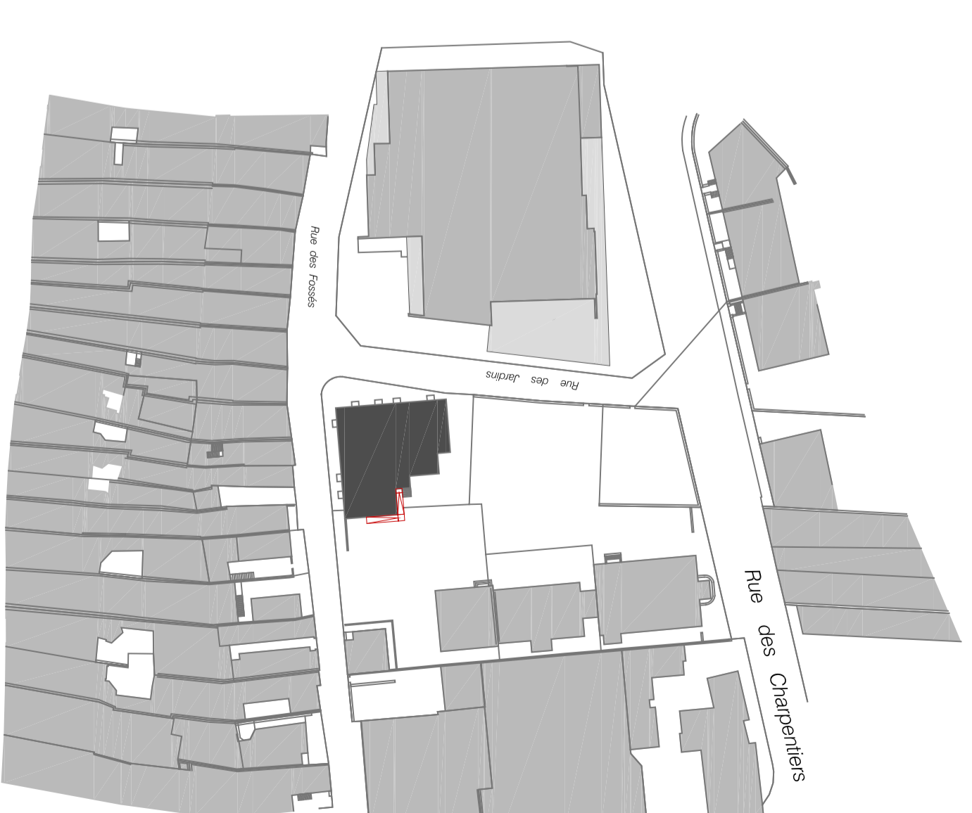
Plan de situation - 1/1000

LEGENDE ■ EXISTANT ■ A DEMOUIR ■ A CONSTRUIRE