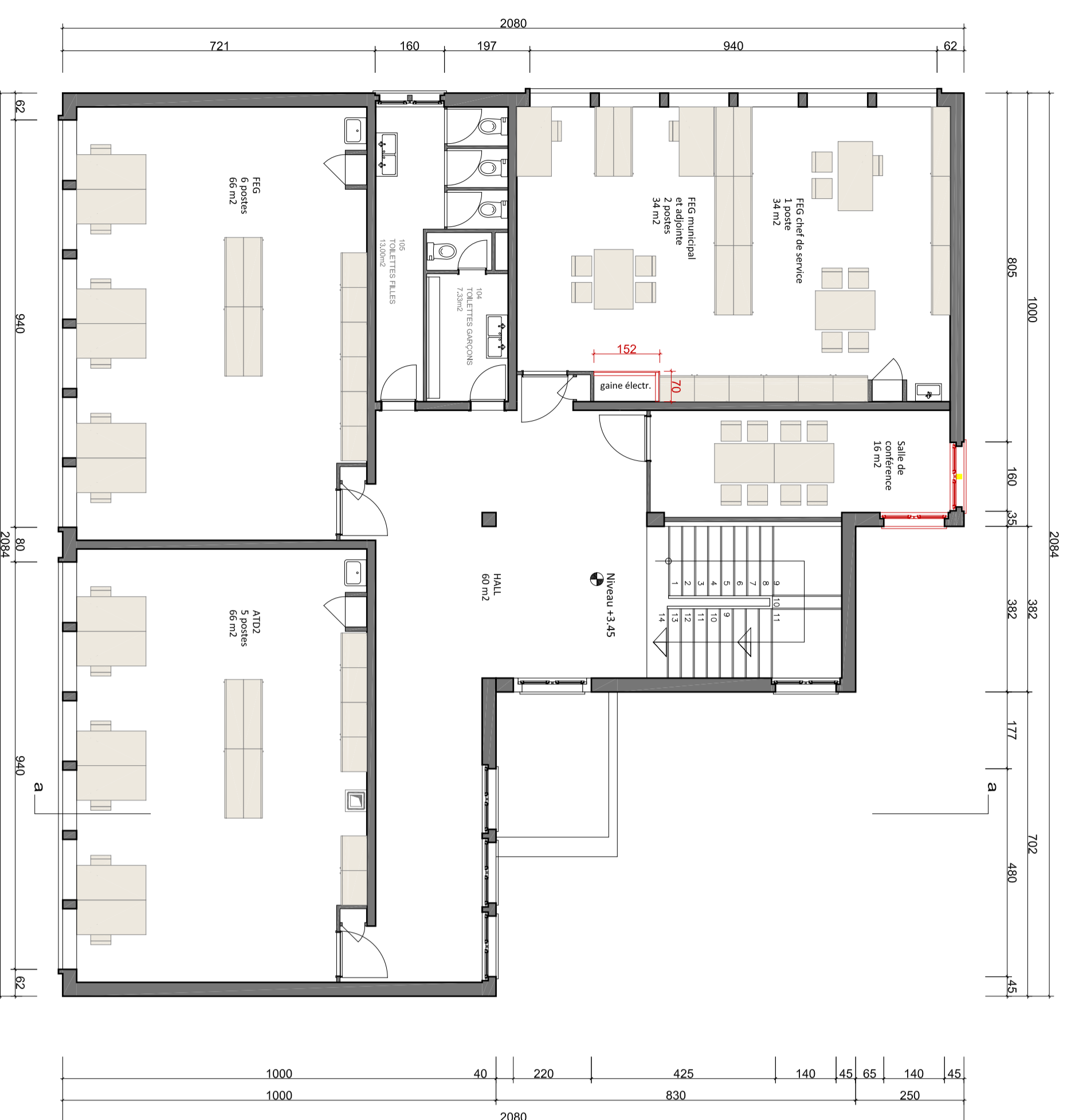
1er étage - 1/1000