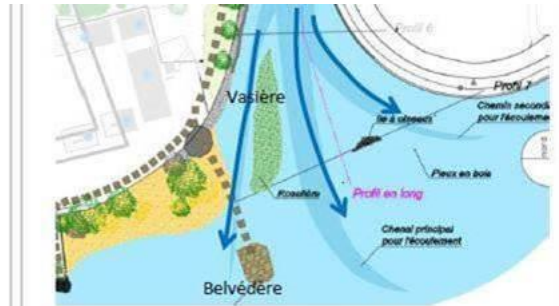
Principe état futur (stade études avant-projet)