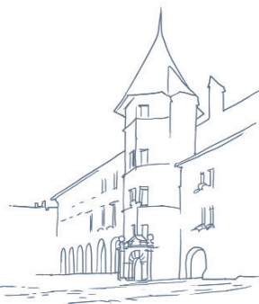
Hôtel de Ville Illustration par P.-A. Rochat