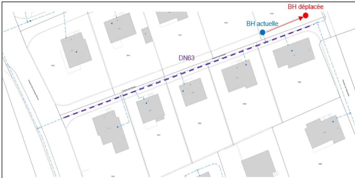
Figure 3: Conduite d'eau potable à réhabiliter au Chemin du Pinson, avec la nouvelle conduite d'eau potable en violet.

Les travaux d'appareillage et la pose de conduites d'eau seront exécutés par les Services Industriels.