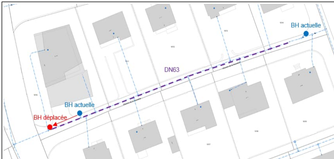
Figure 2: Conduite d'eau potable à réhabiliter au Chemin de la Fauvette, avec la nouvelle conduite d'eau potable en violet.

Les travaux d'appareillage et la pose de conduites d'eau seront exécutés par les Services Industriels.