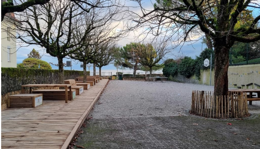
Figure 1 – Nouveaux aménagements de la cour du Bluard

La motion demandait d'aménager les extérieurs de la parcelle Bluard pour les ouvrir sur le quai et favoriser l'accueil de manifestations. Les aménagements réalisés répondent à cette demande.